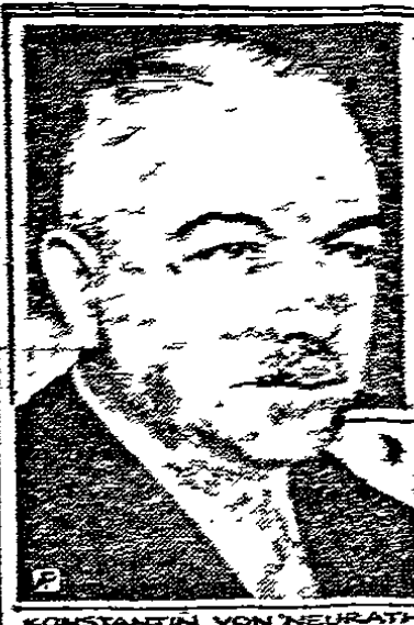
KONSTANTIN VON NEURATH

que estaría por encima de partidos como el guardián de la unidad nacional alemana, el presidente von Hindenburg, el conde de Helldorf y el conde de Helldorf.