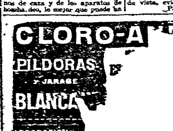
GLORO-A PILDORAS BLANCAS

El problema de la seguridad aérea es uno de los más importantes de la actualidad. Hay que encontrar una solución que permita a las Naciones seguir participando en el comercio internacional.