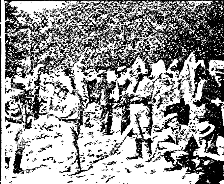
Un campamento de los veteranos que exigen el pago de sus bonos, acampados cerca del Capitolio de Washington.

La Municipalidad de Washington se ve en apuros para darles de comer.